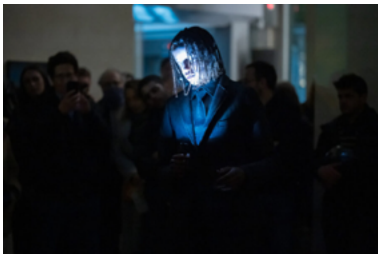
images prises lors de la performance Night Shift à la Fondation Cartier pour l'art contemporain, le 11 avril 2022