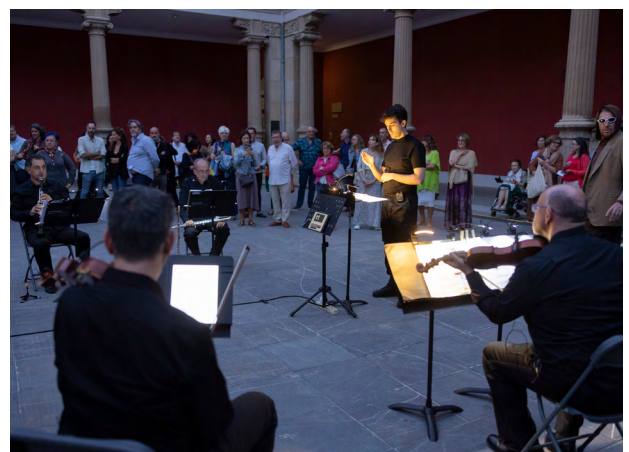
Expérimentation Juana , 2023, La Ribot et OCAZEnigma