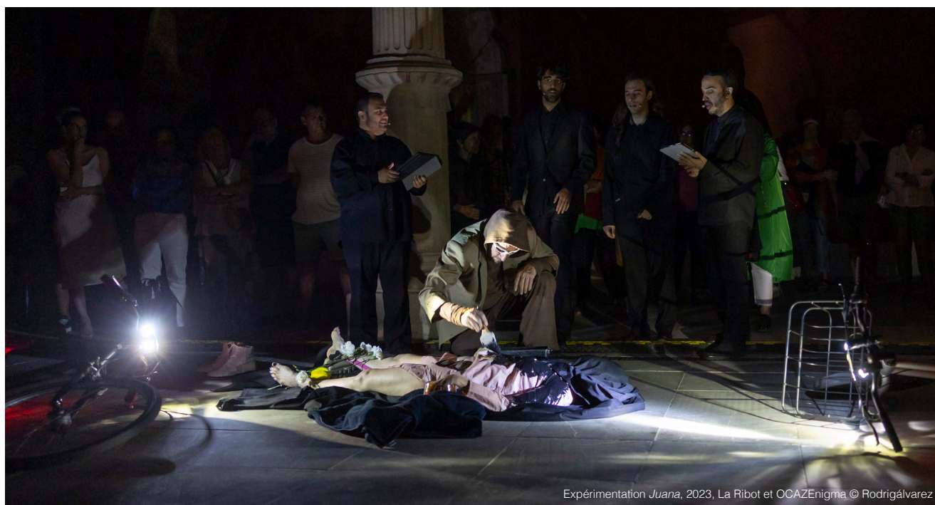
Expérimentation Juana , 2023, La Ribot et OCAZEnigma